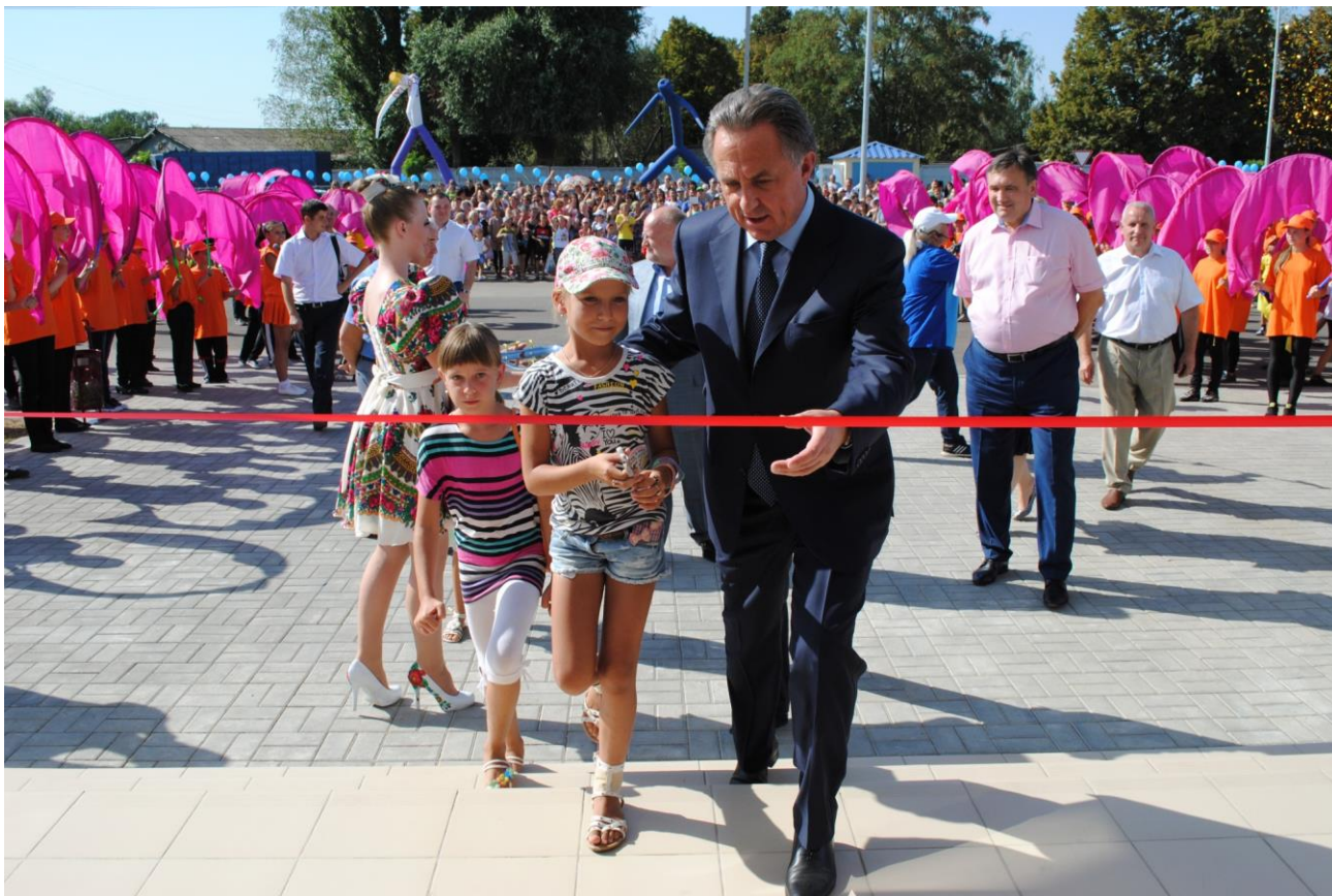
Фото № 3. Открытие спортивного комплекса «Химик»