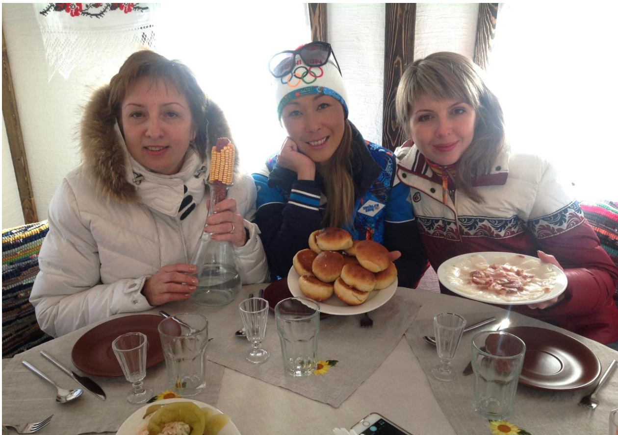
Фото № 1. Курень «Белореченское подворье»

Отмечена положительная динамика развития и сферы бытовых услуг. Количество предприятий бытового обслуживания в 2014 году составило 380 объектов из них 59 предприятий и 321 частный предприниматель. Всего в сфере бытового обслуживания занято около 1 200 человек, функционирует более 750 рабочих мест, что составляет 12 мест на 1000 жителей.